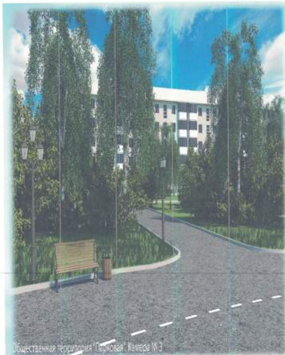
Общественная территория "Парковая", Камера № 3