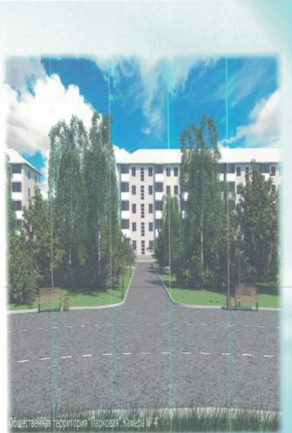
Общественная территория "Парковая", Камера № 4