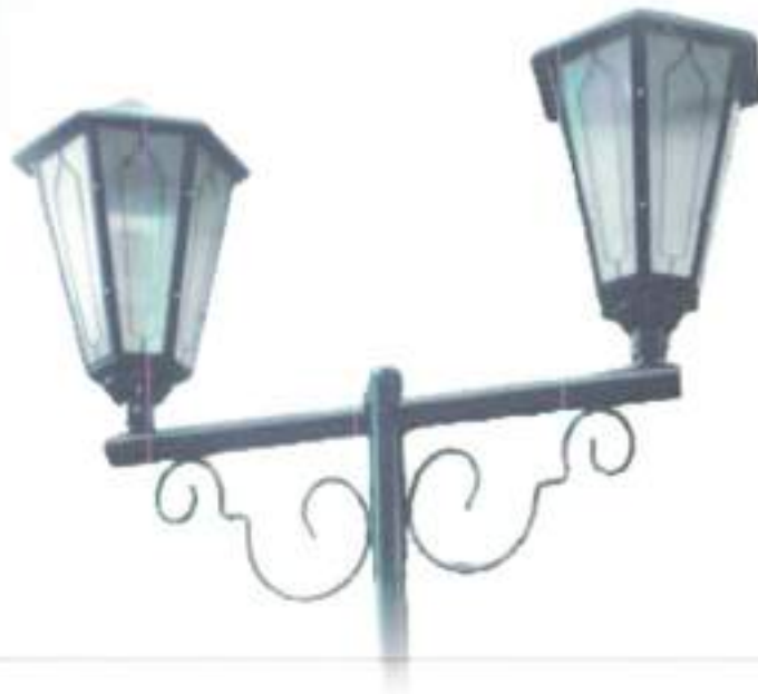
фонарь уличного освещения